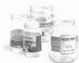
les bocaux de conserve