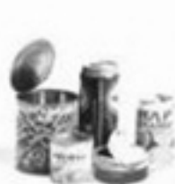
les boîtes de conserve et les boîtes de boisson

Je les porte vides dans le conteneur à bandes jaunes