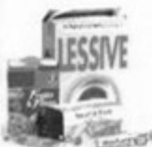
les boîtes, les cartonnets et les sur emballages en carton