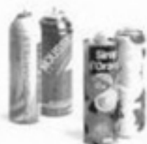
les aérosols et les bidons