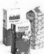
les briques alimentaires